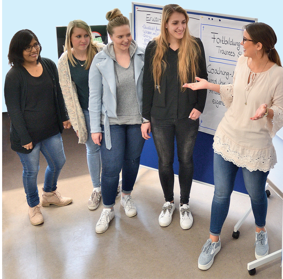
Coaching-Methoden und ihre praktische Anwendung

Während eines Jahres begleiten Mentorinnen und Mentoren Sie als Nachwuchskraft in Ihrem Einsatzbereich.